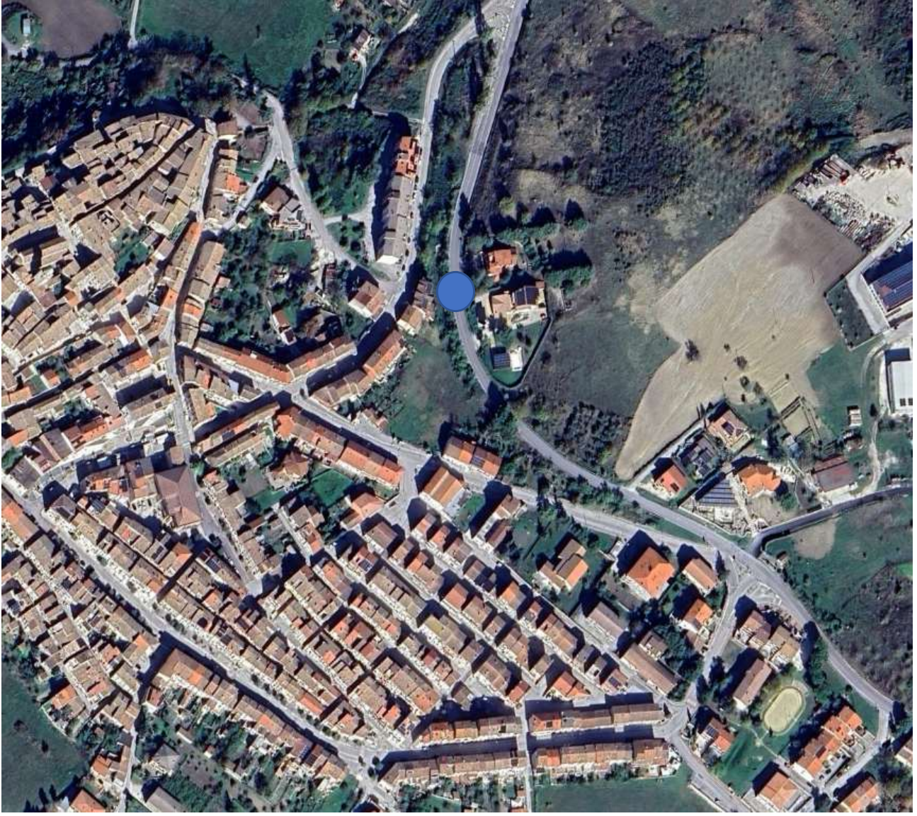
S.P. 13 Km, 10+400