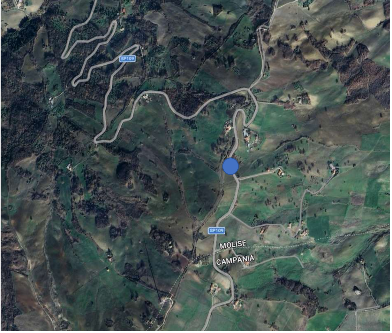
S.P. 109 Km, 4+850