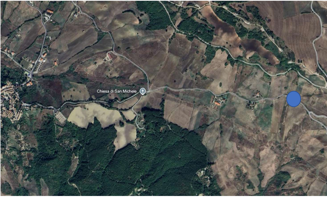
S.P. 71 – Km. 0+200