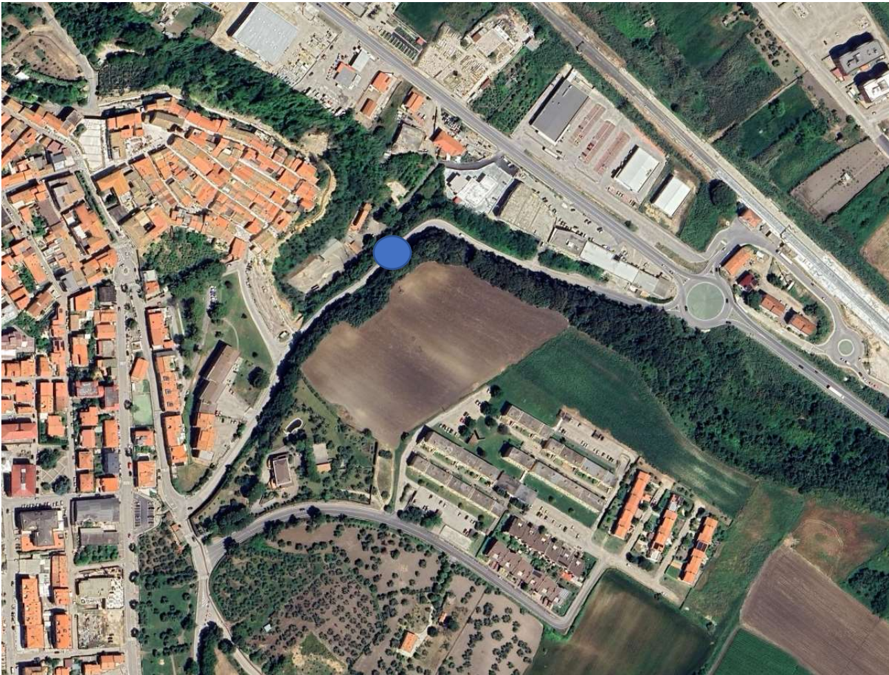
S.P. 40 "Adriatica"