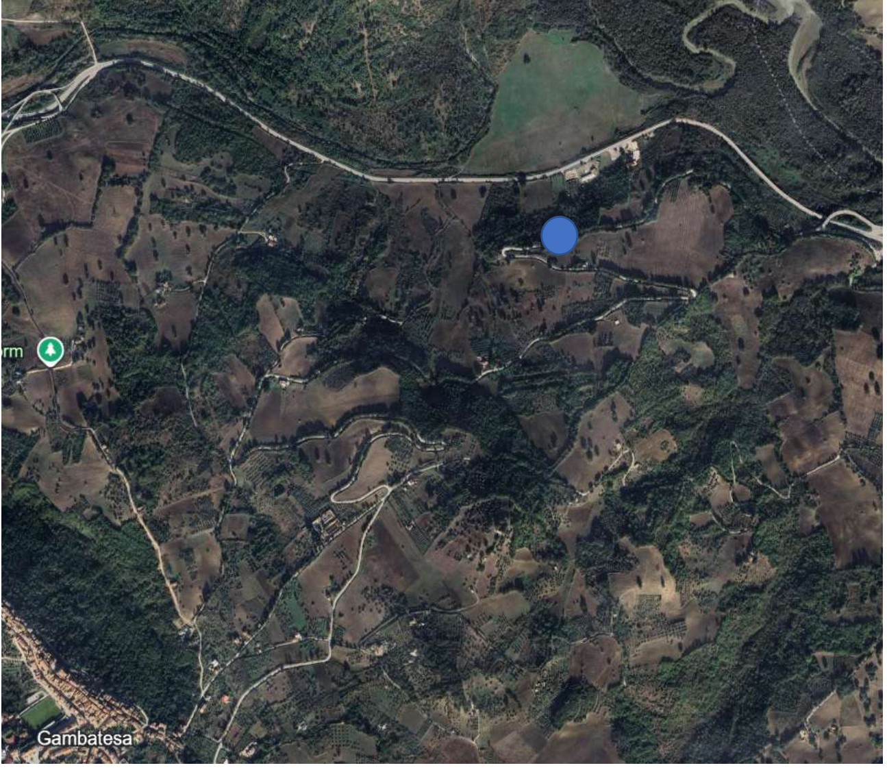
S.P. 162 dir B Km, 1+200